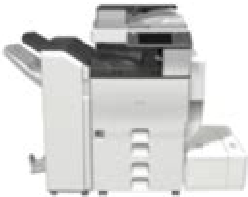
D111/D142 SERVICE MANUAL