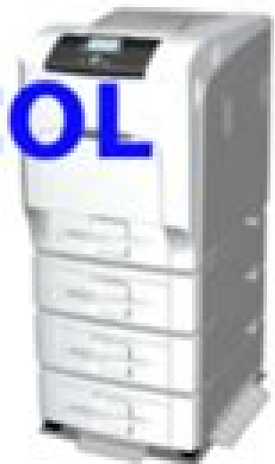
M065/M066 SERVICE MANUAL